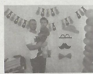
Escola Municipal de Ensino Fundamental Gaúcha